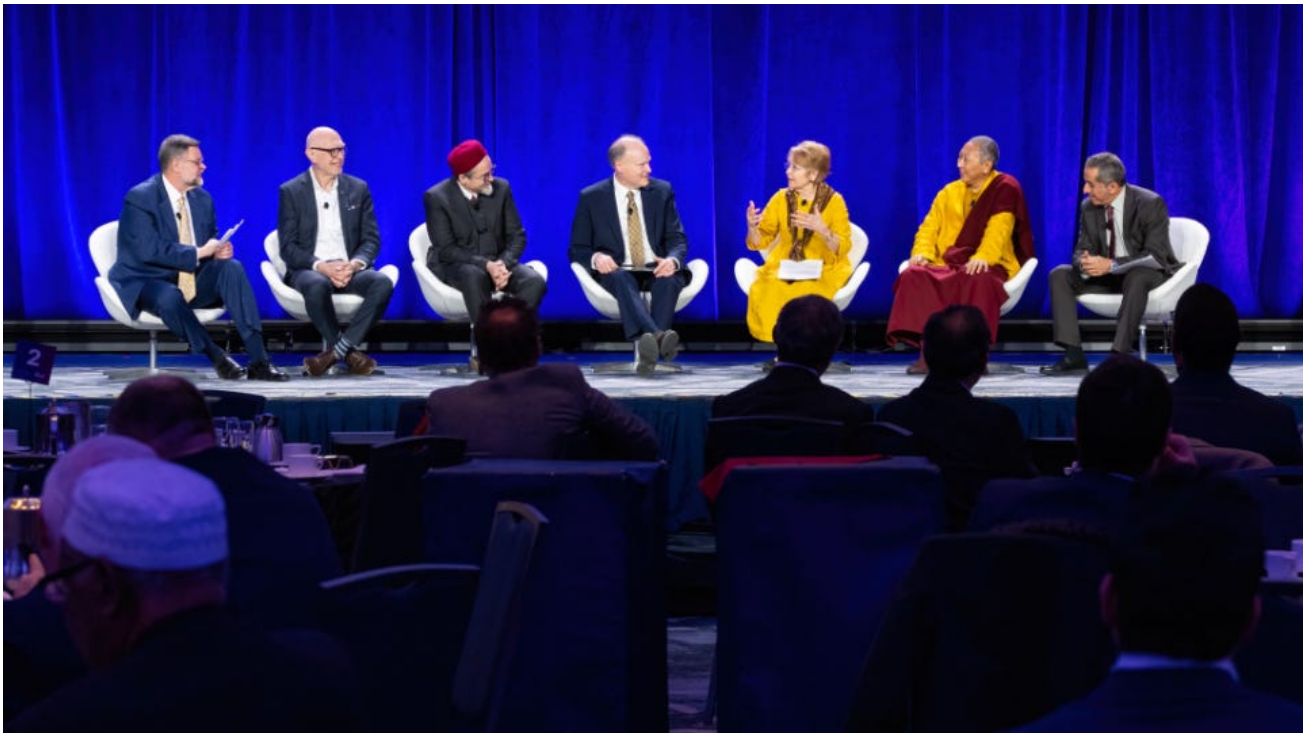
International Religious Freedom Summit, Washington D.C.

Na summitu IRF ve Washingtonu zahájili středoevropští obhájci práv nové fórum, jehož cílem je bojovat proti institucionálním předsudkům a stigmatizaci ze strany médií.